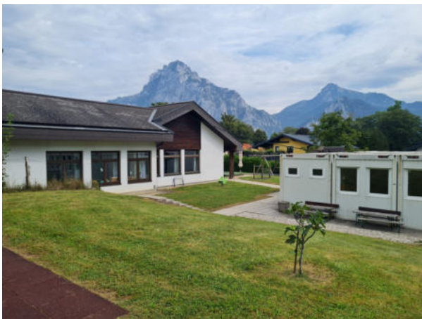
So sieht es jetzt noch aus (Ansicht von Westen).

Zur Jahreshälfte ist es dann so weit: Das alte Gebäude wird (geplant) im August abgerissen und an der selben Stelle wird der neue Kindergarten mit Krabbelstube bis Ende 2027 errichtet. Während der Bauzeit bleibt der Container für den Aufenthalt der Krabbelstube und einer KG-Gruppe bestehen. Zwei Gruppen, Leitungszimmer, Küche und Speiseraum bekommen in der Mehrzweckhalle ihr vorübergehendes Ersatzquartier, und die naturorientierte Gruppe weicht während der Bauzeit in ein Zimmer der Musikschule aus. Und als „Bewegungsraum“ dürfen wir den Turnsaal der Volksschule benützen. Die Umbaumaßnahmen in den Ausweichräumen hat die Gemeinde bereits begonnen. In diesem Zusammenhang ein herzliches Danke der Gemeinde für die vorbildliche Zusammenarbeit mit der Leitung unseres Kindergartens mit deren Einbeziehung in die Planung, insbesondere den Herren Thomas Dreiblmayr und Stefan Heissl - und natürlich auch der Volksschule und dem Musikerheim.